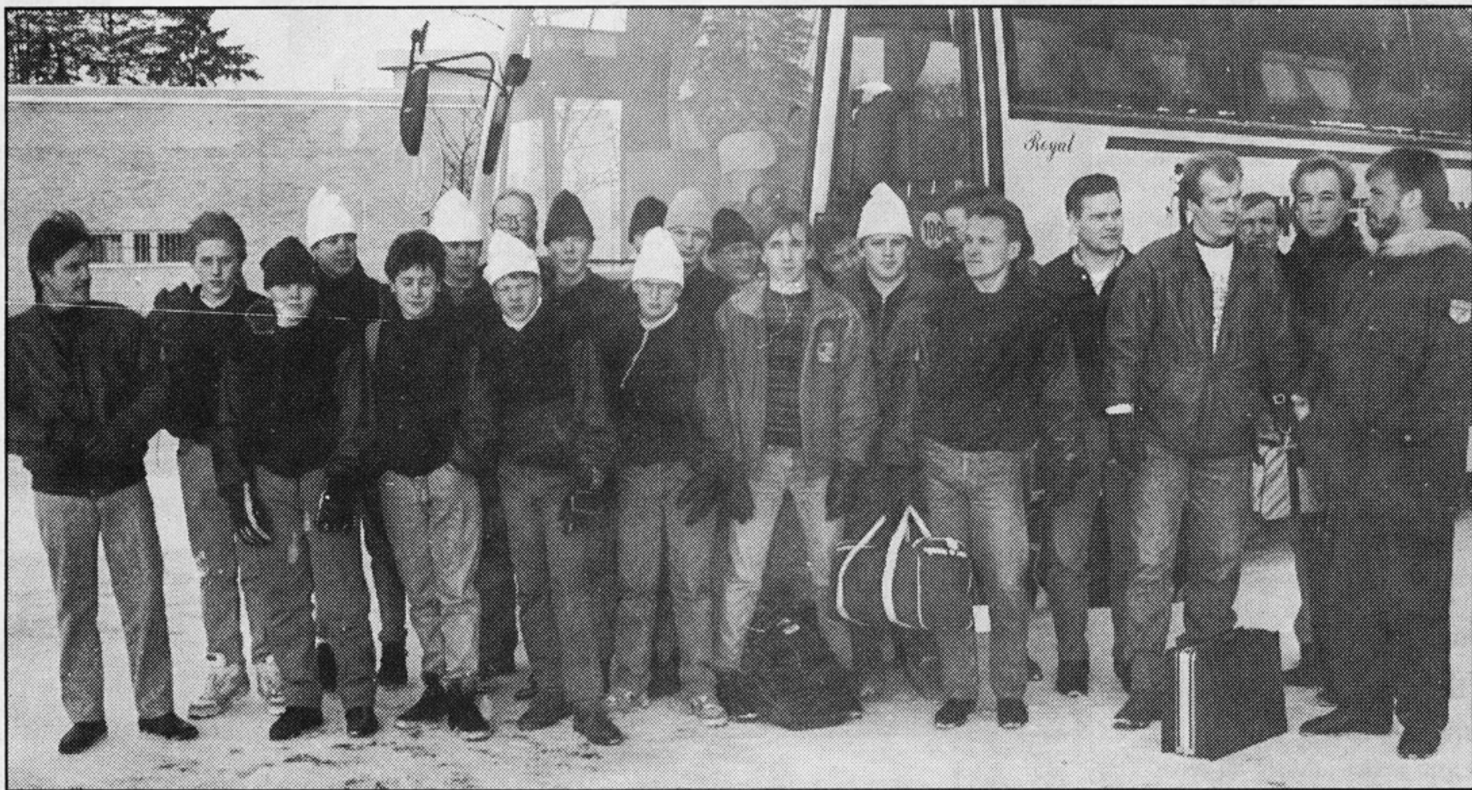
VirtU HT:n C-juniorit huoltojoukkueineen innokkaina Kiovan matkansa lähtötunnelmissä.

Neuvostoliittoon matkanneen Hockeyteamin isäntänä toimii Kiovan Olympiakoulu. Valtio kustantaa joukkueen matkat, majoituksen ja ruoat. Virroilla matkan sponsoreina ovat olleet Virtain kaupunki, Sampo-yhtiöt, Suomi-Neuvostoliitto-seura, Suomenselän Sanomat, Virtain Kalastustarvike sekä Virtain Osuuspankki.